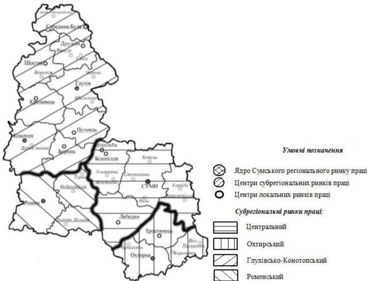
Рис. 2. Територіальна структура Сумського регіонального ринку праці

бединському та Краснопільському локальних ринках. Для нього характерна працenaдлишкова кон'юнктура.