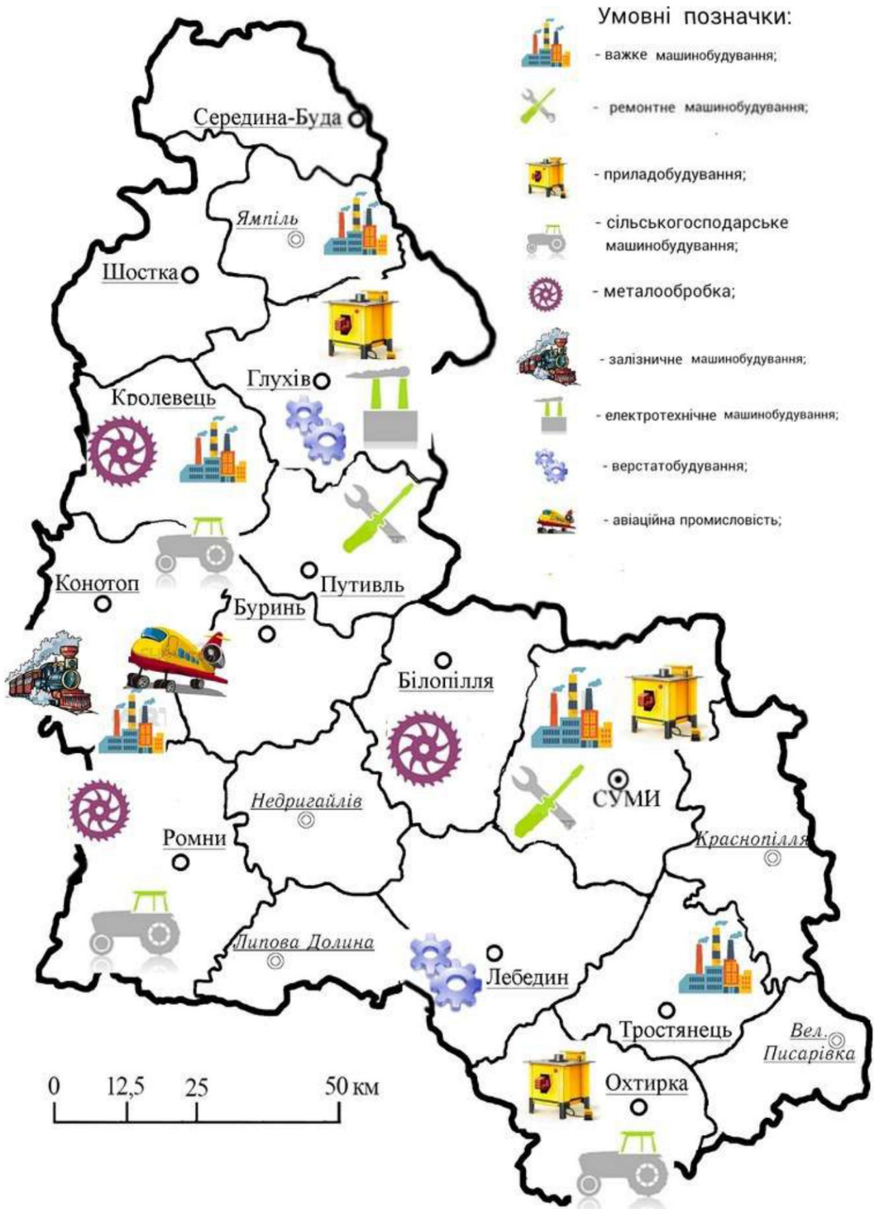
Рис. 2. Територіальна структура машинобудівного комплексу Сумської області